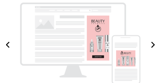
All - Desktop - Mobile

Desktop/ Tablet: 300 x 600 Mobile: 300 x 250 + 320 x 250 Max. weight: 1 MB Extensions: HTML5 / GIF / JPG / PNG