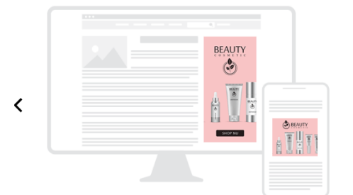
All - Desktop - Mobile

Desktop/ Tablet: 300 x 600 Mobile: 300 x 250 + 320 x 250 Max. weight: 1 MB Extensions: HTML5 / GIF / JPG / PNG