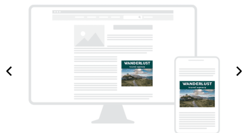
All - Desktop - Mobile

Desktop/ Tablet: 300 x 250 Mobile: 300 x 250 + 320 x 250 Max. weight: 1 MB Extensions: HTML5 / GIF / JPG / PNG